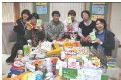
2/20 カーブス阿久比さま 社会貢献フードドライブ 来訪 今年もたくさんの品物と善意をいただきました。大切に使用させていただきます。