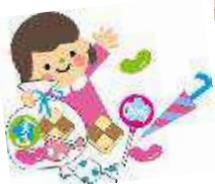
手作り体験&駄菓子屋さん