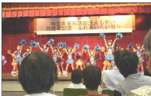
元気一杯!! みんなかわいい 「チアキッズ GOGO」