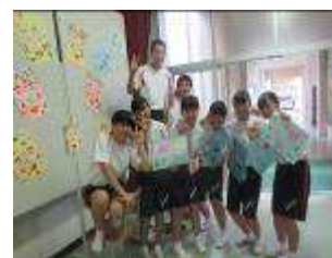
10/10 東部小学校 福祉実践教室高齢者疑似体験