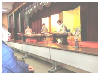
箏曲中山会の皆さまによる心和む琴演奏